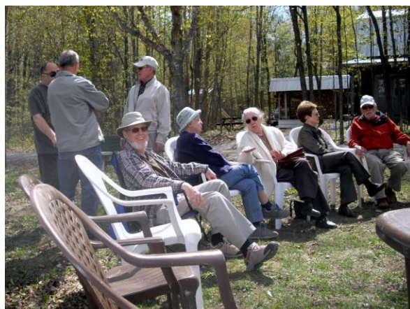
Après le lancement des activités d'été, il y a eu les marches et le vélo. Tous les participants apprécient beaucoup ces sorties.